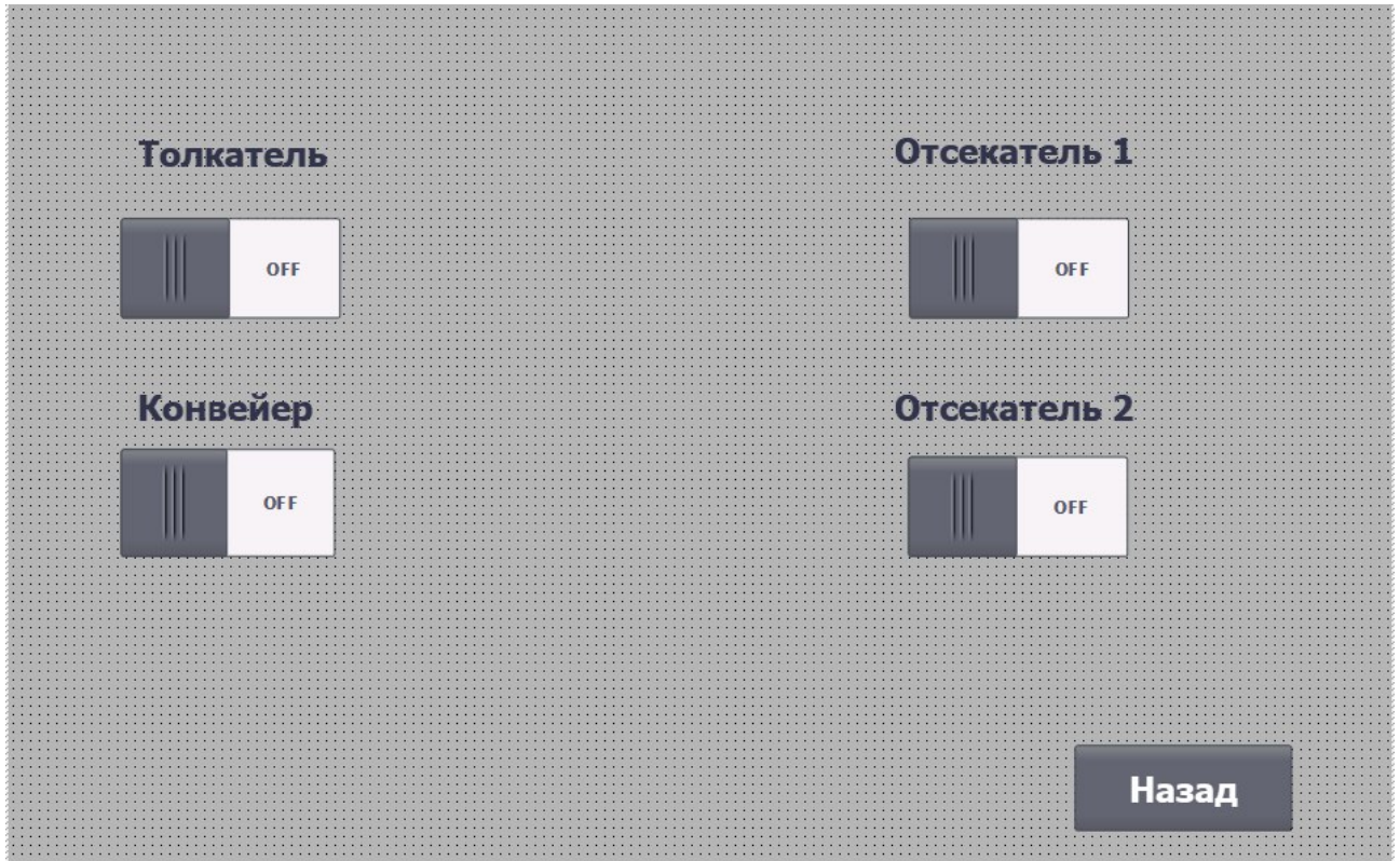
2) Ручное управление;